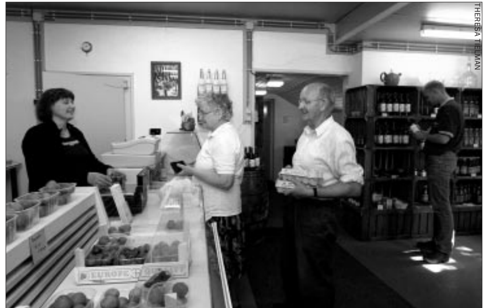
Persoonlijk contact met de klant is voor veel agrotouristische ondernemers een reden om eigen boerderijproducten aan huis te verkopen.

Voordat zij van start gingen met een touristische activiteit, gingen de meeste ondervraagde ondernemers te rade bij collega's voor ideeën, tips en advies. Daarnaast werden GLTO, gemeenten, de provincie en de Kamer van Koophandel geraadpleegd. Opmerkelijk is dat slechts twee ondernemers een ondernemingsplan hebben geschreven. Geen enkele ondernemer liet marktonderzoek uitvoeren en slechts zeven hielden rekening met het bestaande aanbod in de omgeving. Gezien de toenemende interesse van on-