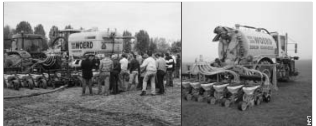
Een betere mineralenefficiëntie is haalbaar met de zaaimachine met drijfmestrijenbemester achter een driewieler.

De kosten van de gangbare methode en die van drijfmestrijenbemesting ontlopen elkaar nauwelijks. Voor de gangbare methode bedragen deze € 189,- voor bouwland injectie, zaaïen en maïsmap. Drijfmestrijenbemesting kost € 190,- voor zaaïen en bemesten en de huur van een container. Voordeel is dat organische mest bij drijfmestrijenbemesting beter wordt benut. Hierdoor kunt u meer organische mest toedienen op grasland. Aangezien Minas wordt afgeschaft en plaats maakt voor nog scherpere normen, moet de mineralenefficiëntie op bedrijfsniveau verder omhoog. Met drijfmestrijenbemesting kan dit.