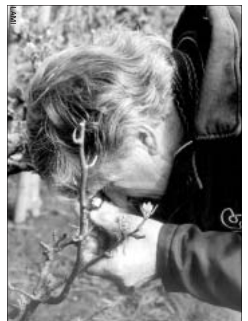
Geïntegreerde bestrijding valt of staat met goed waarnemen.

In het project 'Duurzame fruitteelt' vergroten fruittelers hun kennis over geïntegreerde gewasbescherming, mineralenbeheer of bedrijfsinterne milieuzorg. Ook in 2004 loopt dit project door met demo's, excursies en studiegroepen. Nieuwe deelnemers zijn uiteraard zeer welkom! Voorbeelden van onderwerpen zijn: de bestrijding van schurft en zwartvruchtrot met behulp van waarschuwingssystemen, geïntegreerde bestrijding van plaaginsecten, water geven en bemesting. Ook nieuwe onderwerpen zijn welkom. Fruittelers worden via een mailing over het programma voor 2004 geïnformeerd. Zie ook de LaMi-website www.lami.nl . Of vul de bon in of bel met projectcoördinator Joke Janse, telefoon: (030) 634 54 99, e-mail: jjanse-lami@glto.nl